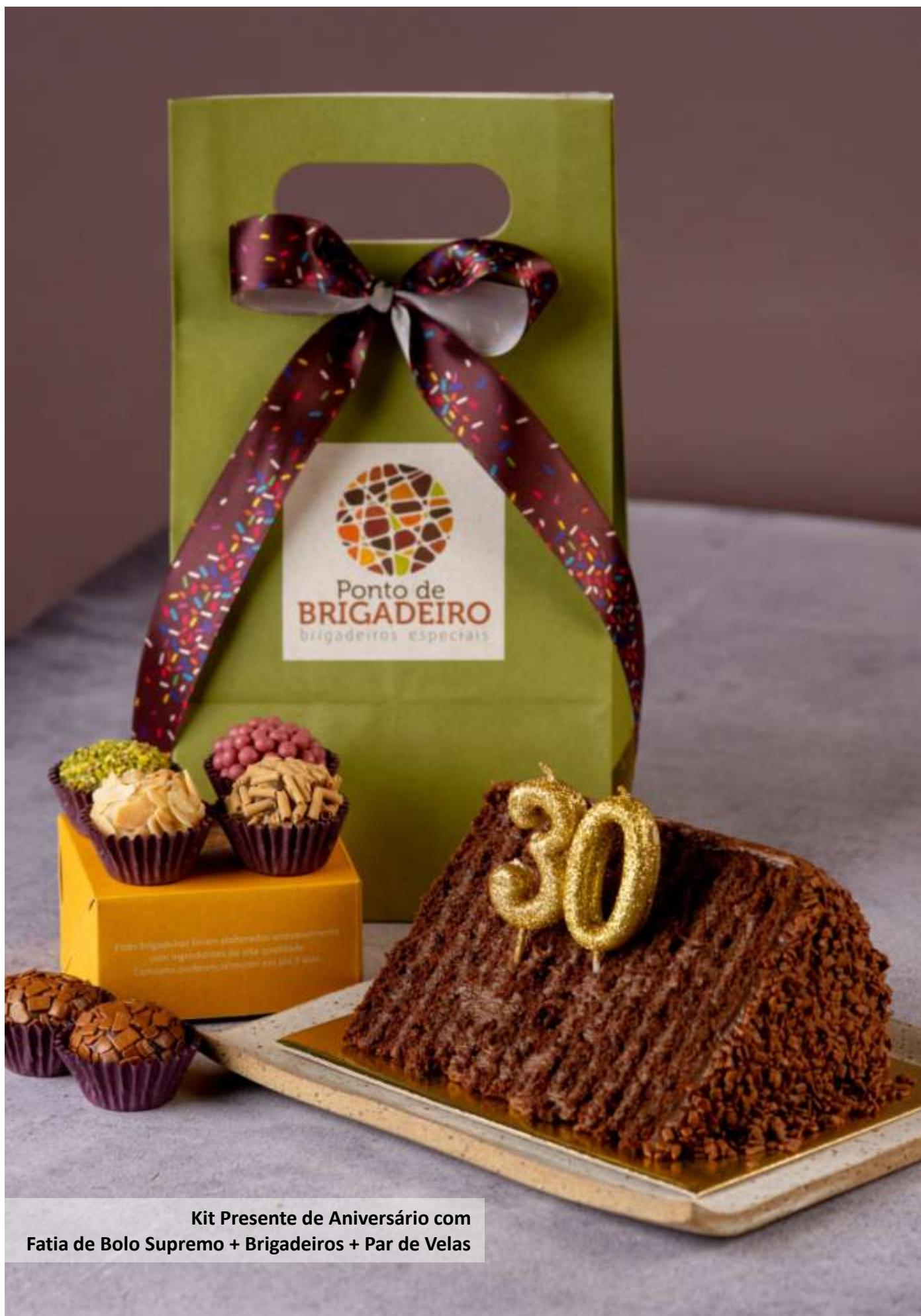
Kit Presente de Aniversário com Fatia de Bolo Supremo + Brigadeiros + Par de Velas