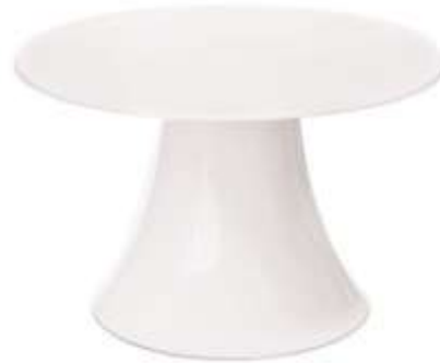
Prato Bailarina Metal