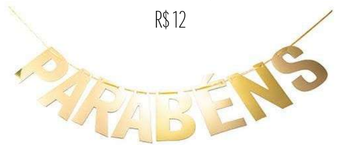
Faixa Decorativa R$ 12