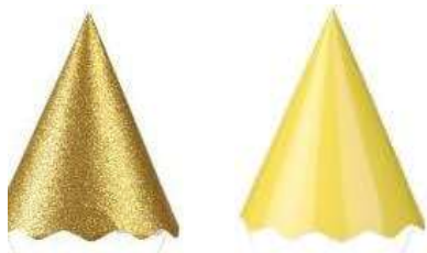
Chapéus 8 und – R$ 19