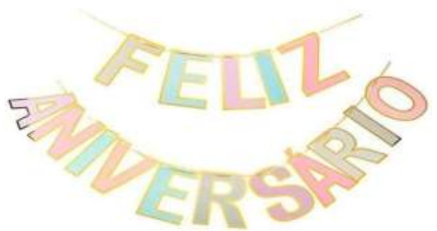
Faixa Decorativa R$ 12