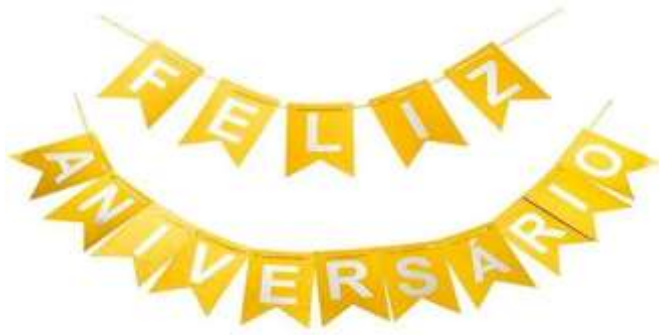
Faixa Decorativa R$ 12